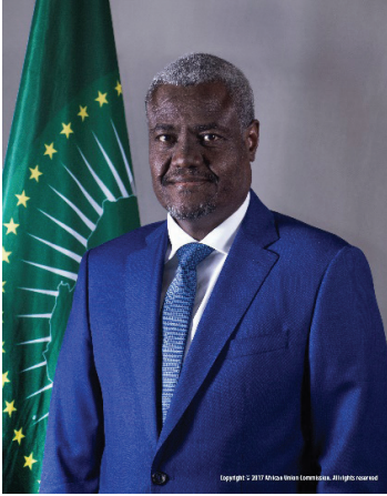
H.E. Moussa Faki Mahamat Presidente Comisión de la Unión Africana

Hace más de un decenio, África elaboró su propia estrategia para la Reducción del Riesgo de Desastres (RRD). La estrategia no solo contribuyó al Marco de Hyogo para la Reducción del Riesgo de Desastres (2005-2015), sino que también propició avances en la RRD en el continente.