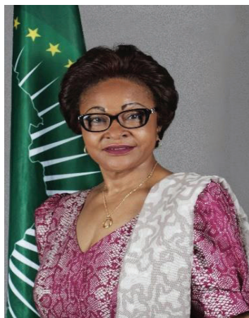
H.E. Josefa Leonel Correia Sacko Comisionada de Economía Rural y Agricultura Comisión de la Unión Africana

Poco después de la aprobación del Marco de Sendái para la Reducción del Riesgo de Desastres en la Tercera Conferencia Mundial sobre la Reducción del Riesgo de Desastres, celebrada en el Japón en marzo de 2015, la Comisión de la Unión Africana guio al continente hacia la elaboración del Programa de Acción para la aplicación del Marco de Sendái para la Reducción del Riesgo de Desastres 2015-2030 en África.