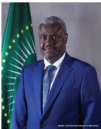
H.E. Moussa Faki Mahamat Presidente Comisión de la Unión Africana

Hace más de un decenio, África elaboró su propia estrategia para la Reducción del Riesgo de Desastres (RRD). La estrategia no solo contribuyó al Marco de Hyogo para la Reducción del Riesgo de Desastres (2005-2015), sino que también propició avances en la RRD en el continente.